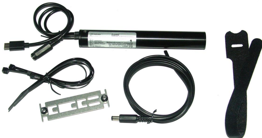
Bild 1: Lösbarer Montagesatz (mit Harvester USB-PM), Powerstecker/-Kuppler (wasserdichter Stecker möglich)